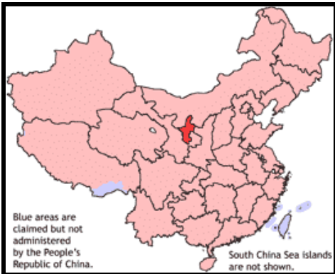
Kina i vor tid - Ningxia provinsen er markeret